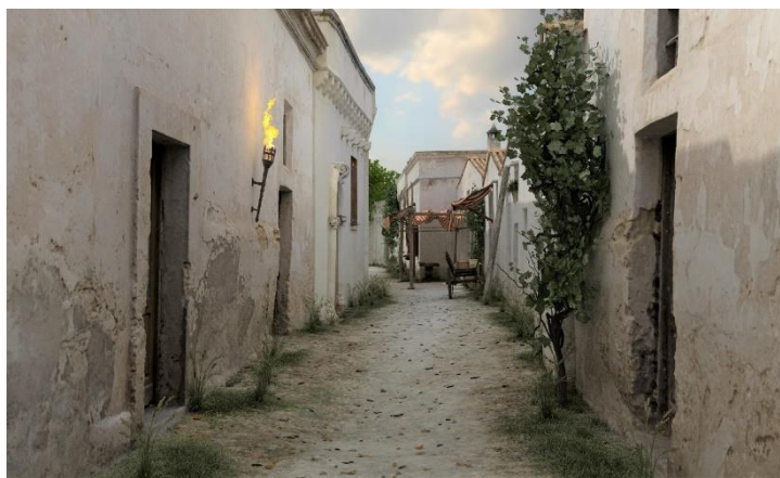
Ricostruzione virtuale di Vico della Saponea

Su richiesta sarà, quindi, possibile aggiungere alla visita guidata l'esperienza di realtà aumentata (per info e costi pag. 13). Attraverso un visore per la realtà virtuale indossabile sul viso (oculus) si percorreranno virtualmente le vie della giudecca medievale, si entrerà nella sinagoga leccese, si ammireranno gli affreschi della Torre di Belloluogo e molto altro.